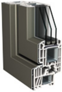
Classic-line Door funktionssicherer Türflügel aus Kunststoff-Aluminium mit sehr guten Dämmeigenschaften