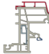
Blindzargenrahmen rationell und vielseitig einsetzbar

Dank der zahlreichen Flügel- und Blendrahmenvarianten bieten die Kunststoff-Aluminium-Fenster von FINSTRAL Lösungen, die sämtlichen Ansprüchen gerecht werden.