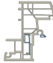
Blindzargenrahmen rationell und vielseitig einsetzbar